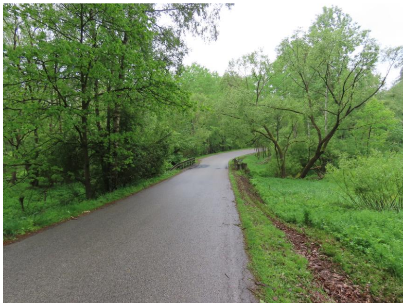
Pohled ve směru do Malého Žďáru

Území v blízkosti stavby a plochy v bezprostřední blízkosti mostního objektu jsou určeny pro zachování a rozvoj přírodních hodnot území případně jsou uvažovány jako zeleň. V předpolí mostu při pravobřežní opěře se nachází vlevo sjezd na pozemek p.č. 711/1.